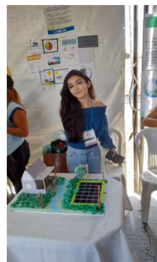
Figura 3 – Protótipo construído para Feira de Ciências com demonstração do funcionamento da energia solar