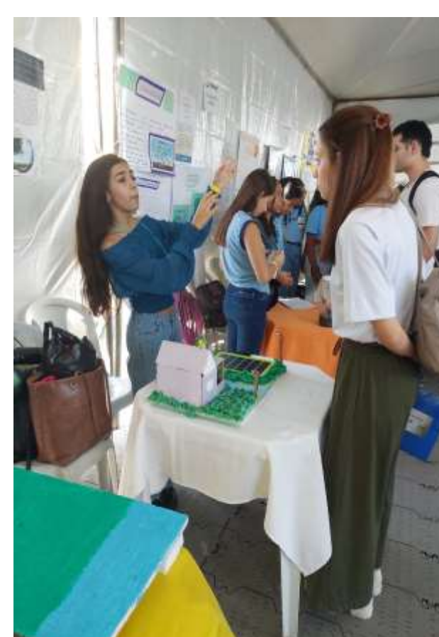
Figura 2 – Protótipo construído para Feira de Ciências com demonstração do funcionamento da energia solar