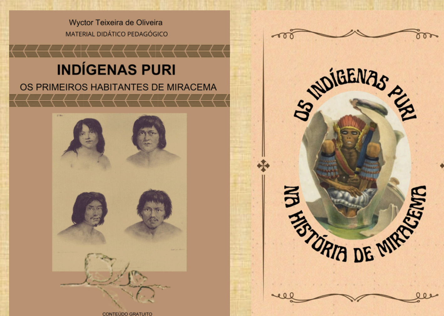
Capa do Material Didático Pedagógico/Material de Pesquisa sobre os Puri

O projeto desenvolvido busca resgatar e preservar a história dos indígenas Puri em Miracema, enfatizando a importância dessa etnia na formação cultural da região. Durante o processo de pesquisa, foi criado um material didático-pedagógico, em conformidade com a Lei 11.645, que obriga o ensino da história e cultura indígena no currículo escolar. Esse material educacional visa não apenas informar, mas também incentivar a valorização e o respeito pelas tradições Puri, contribuindo para a conscientização e inclusão dessa cultura no ambiente escolar. Além disso, foi elaborado um material de estudo detalhado sobre o povo Puri, oferecendo uma visão aprofundada de sua história, costumes e contribuições à identidade local. Esse estudo serve como um recurso acessível para professores, estudantes e demais interessados, promovendo uma compreensão mais ampla da herança indígena em Miracema. O projeto também propõe a renovação do acervo cultural do Centro Cultural Melchiades Cardoso, que abriga grande parte do patrimônio histórico da cidade. A inclusão de registros e artefatos da cultura Puri nesse acervo visa fortalecer o reconhecimento do legado indígena no contexto cultural de Miracema, permitindo que as gerações futuras tenham acesso a uma representação mais completa da história local. Assim, o projeto cumpre um papel essencial na revitalização da memória histórica dos Puri e na promoção de uma identidade cultural mais inclusiva para a comunidade de Miracema.