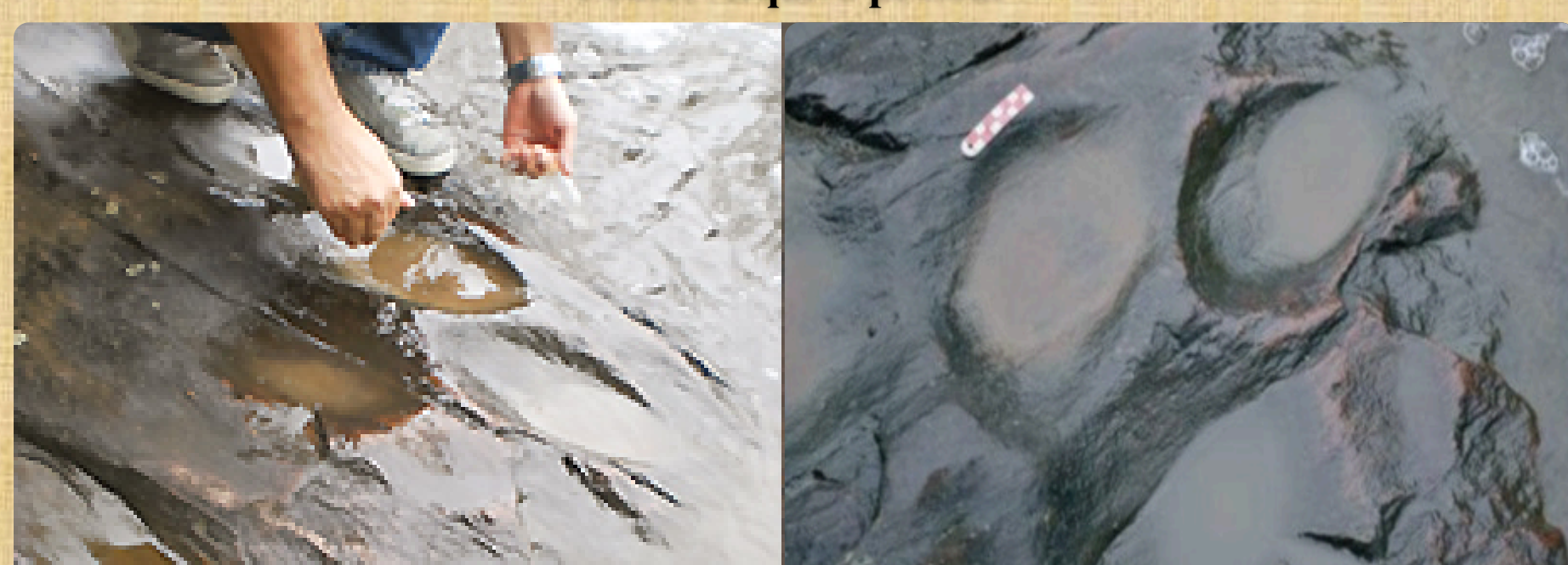
Sítio arqueológico do tipo polidor/amolador, localizado na Fazenda Santa Inês, em Paraíso do Tobias.