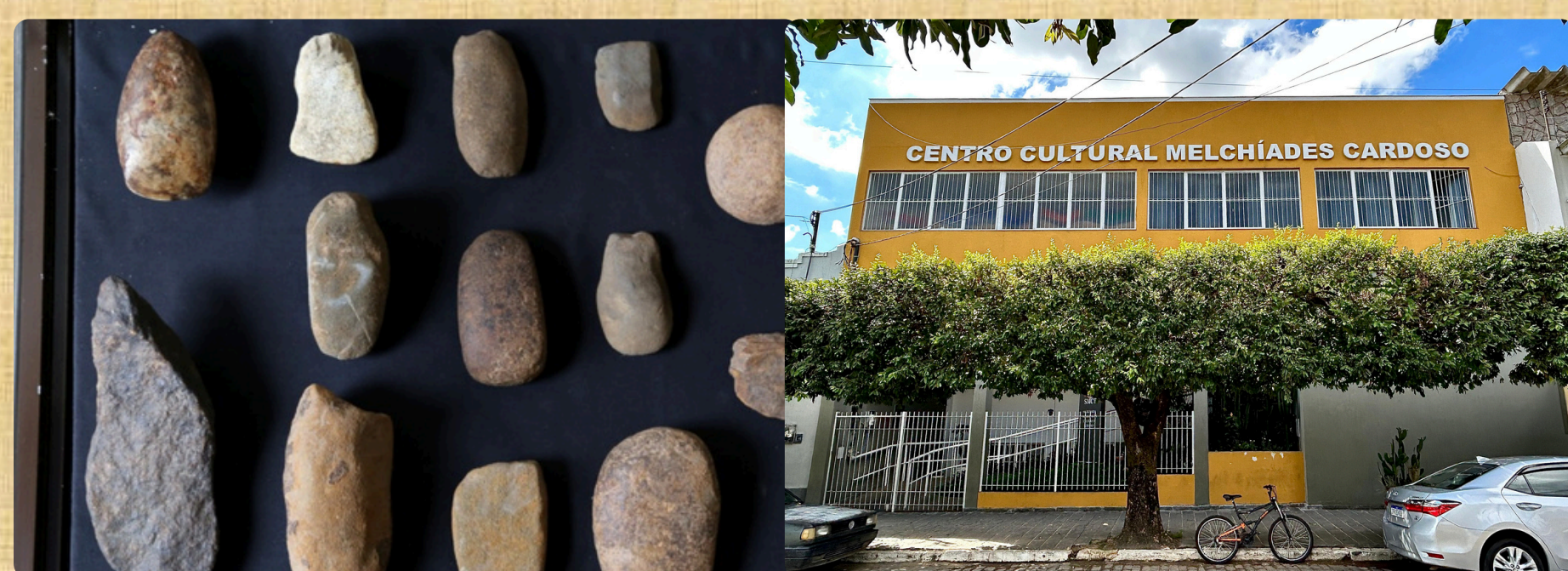
Artefatos de origem Puri encontrados em exposição no centro cultural Melchiades Cardoso em Miracema - RJ.