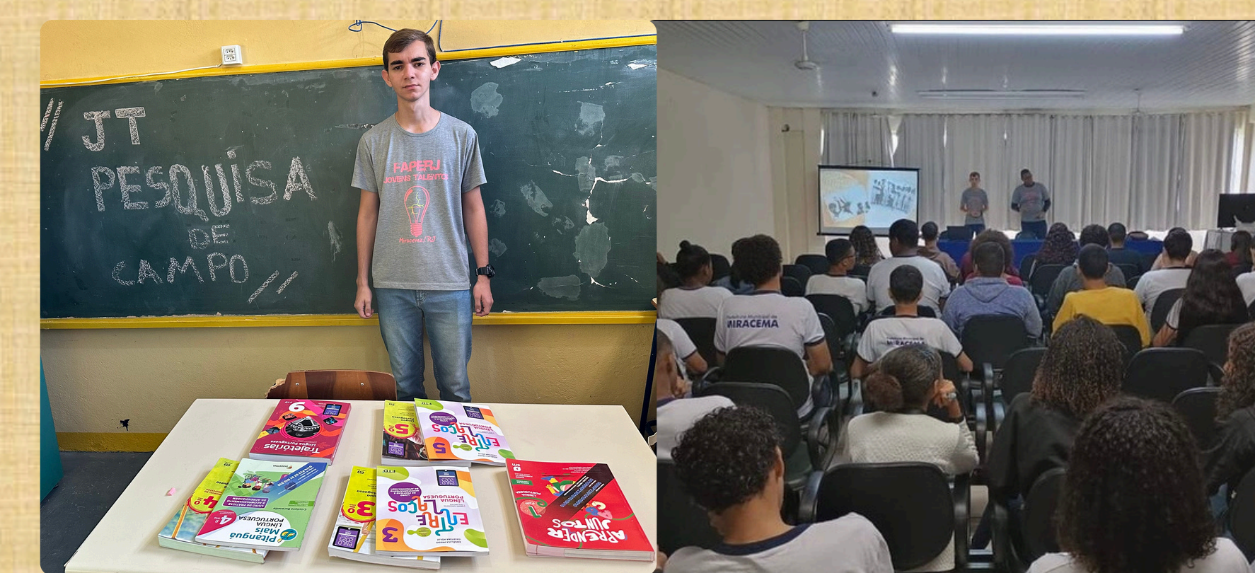
Registros da pesquisa de campo com os livros didáticos realizada no Colégio Municipal Prudente de Moraes e palestra sobre o dia dos povos indígenas no Centro Cultural Melchiades Cardoso

Durante este projeto, promovemos a conscientização sobre a história dos Puri e sua relevância na identidade de Miracema. Criamos um material de estudos que explora os vestígios materiais e imateriais dos Puri, destacando sua presença contínua no estado do Rio de Janeiro. No Dia dos Povos Indígenas, 19 de abril, realizamos uma palestra no Centro Cultural Melchiades Cardoso para alunos do Colégio Municipal Prudente de Moraes e do Colégio Estadual Deodato Linhares, incentivando a reflexão sobre a cultura indígena. Também realizamos pesquisas nas escolas municipais e estaduais para verificar o cumprimento da Lei nº 11.645/2008, analisando conteúdos dos livros didáticos. Com base nesses dados, sugerimos ajustes incorporados ao material didático, que será usado após aprovação das autoridades locais. Essas ações visam valorizar a história dos Puri e fomentar a conscientização sobre a cultura indígena, promovendo uma educação inclusiva e respeitosa.