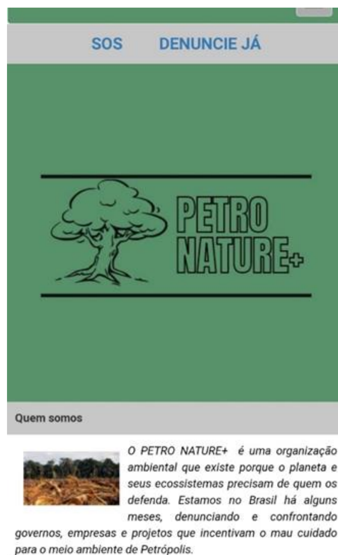
Imagem 1: Apresentação do aplicativo Petro Nature+ .

O objetivo principal do aplicativo é promover denúncias a respeito de agressões ao meio ambiente. Portanto a aba DENÚNCIAS foi a responsável pela captação de fotos, vídeos e relatos, os quais são encaminhados aos órgãos competentes.