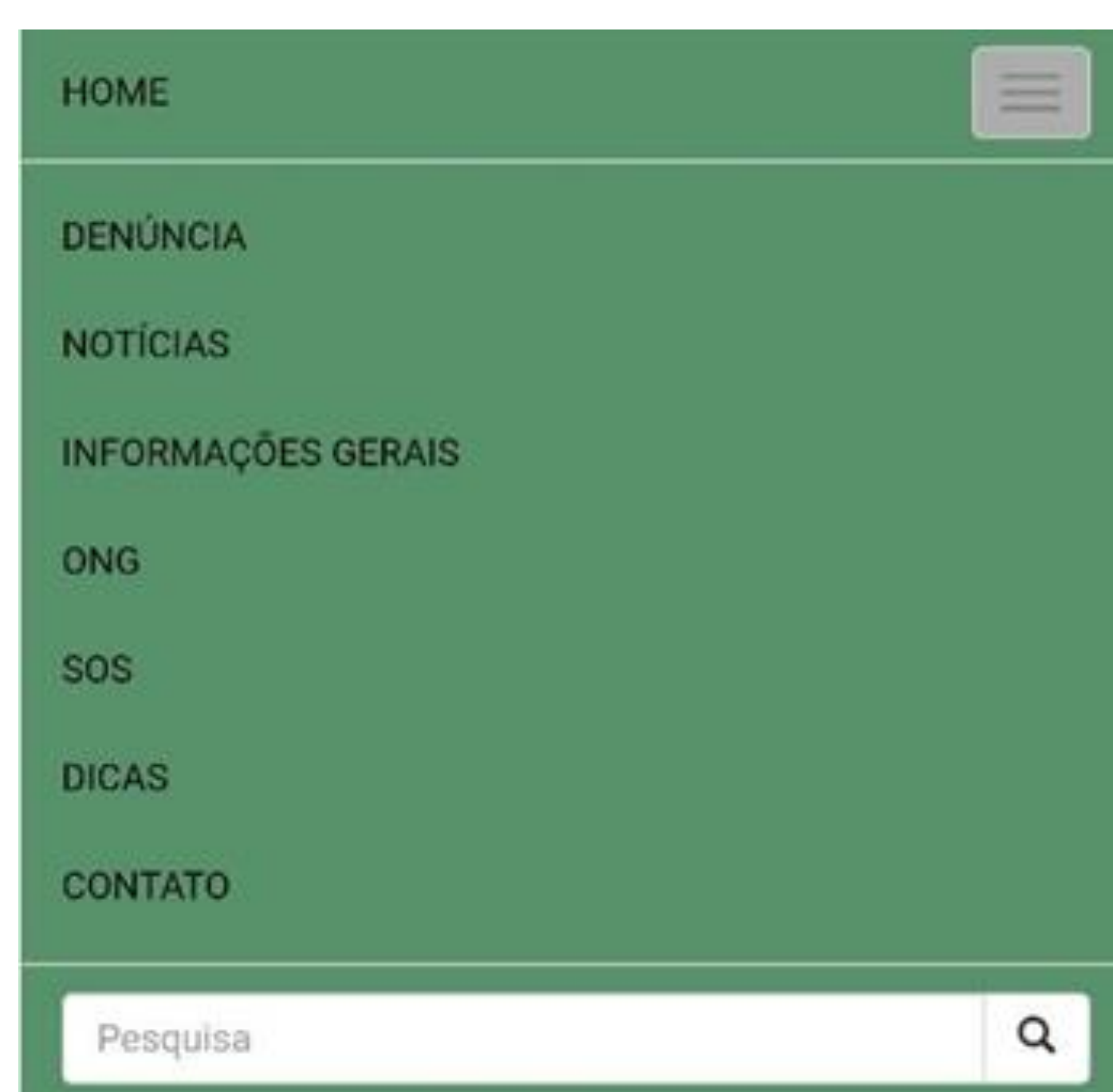
Imagem 2: Principais funcionalidades e a aba de pesquisa de termos-chave.

A Imagem 1 apresenta a interface de apresentação do app, na qual é possível identificar os motivos pelos quais o aplicativo foi criado, destacando-se a preocupação, dos criadores, com a preservação do meio ambiente.