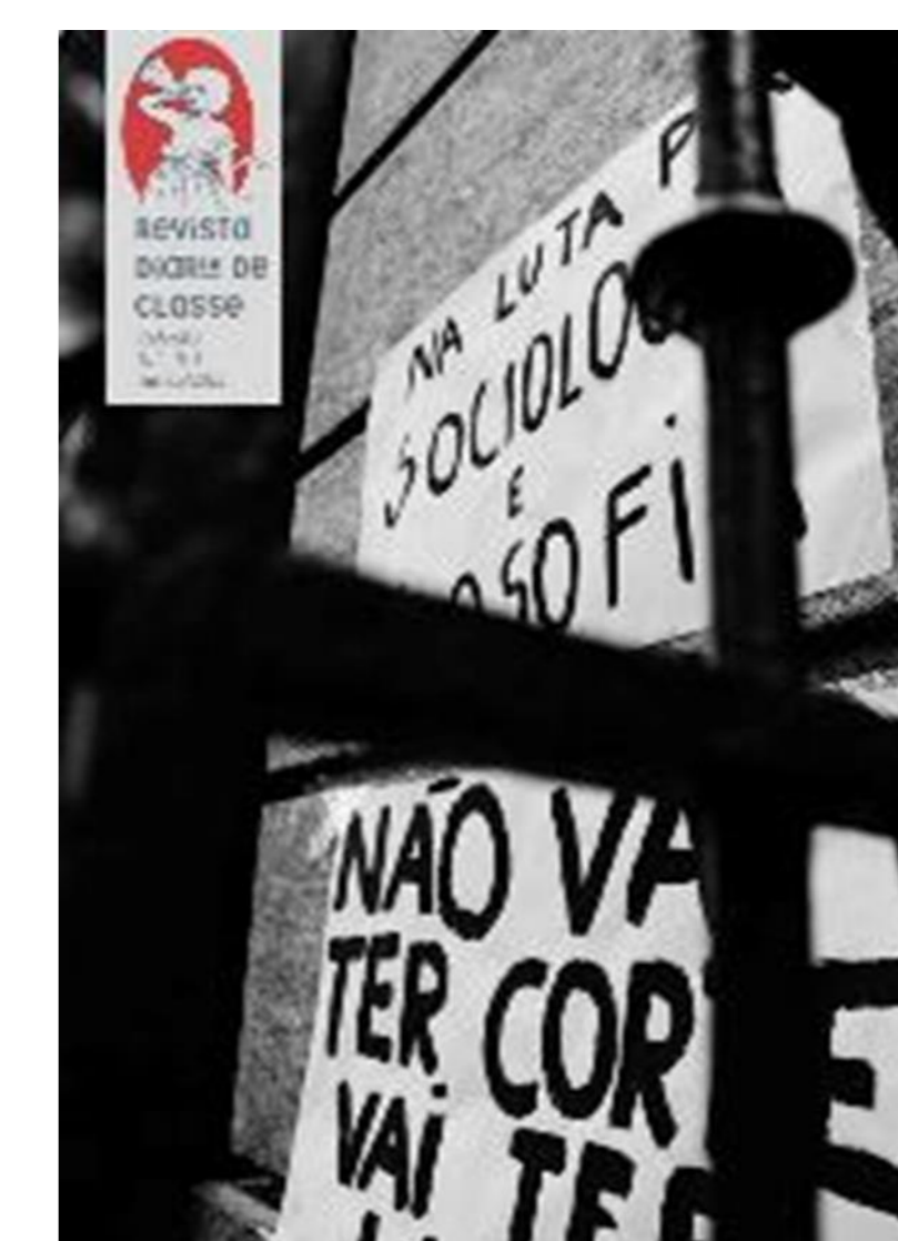
Imagem 5 – Ed.1