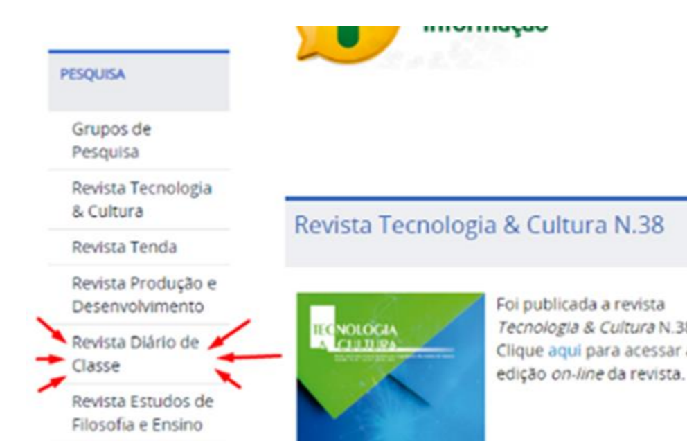
Imagem 4 - Página oficial do CEFET-RJ: http://cefet-rj.br/index.php com o link para o site da revista: https://revistas.cefet-rj.br/index.php/diariodeclasse

Neste ano, publicamos duas edições da nossa revista, a primeira em março e a segunda em setembro: