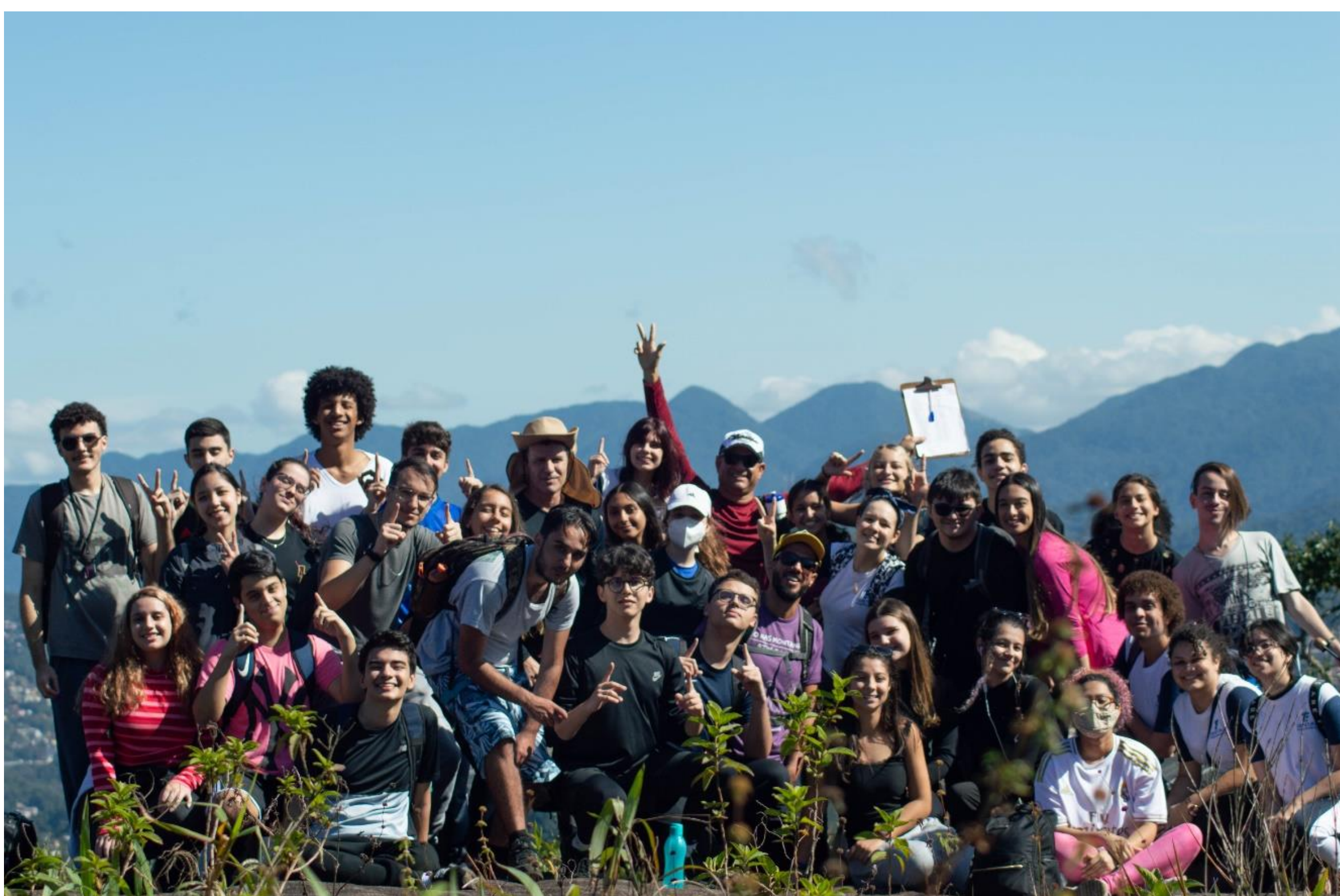
Expedição com o 3º ano do curso Técnico em Telecomunicações Integrado ao Ensino Médio (Maio de 2022).