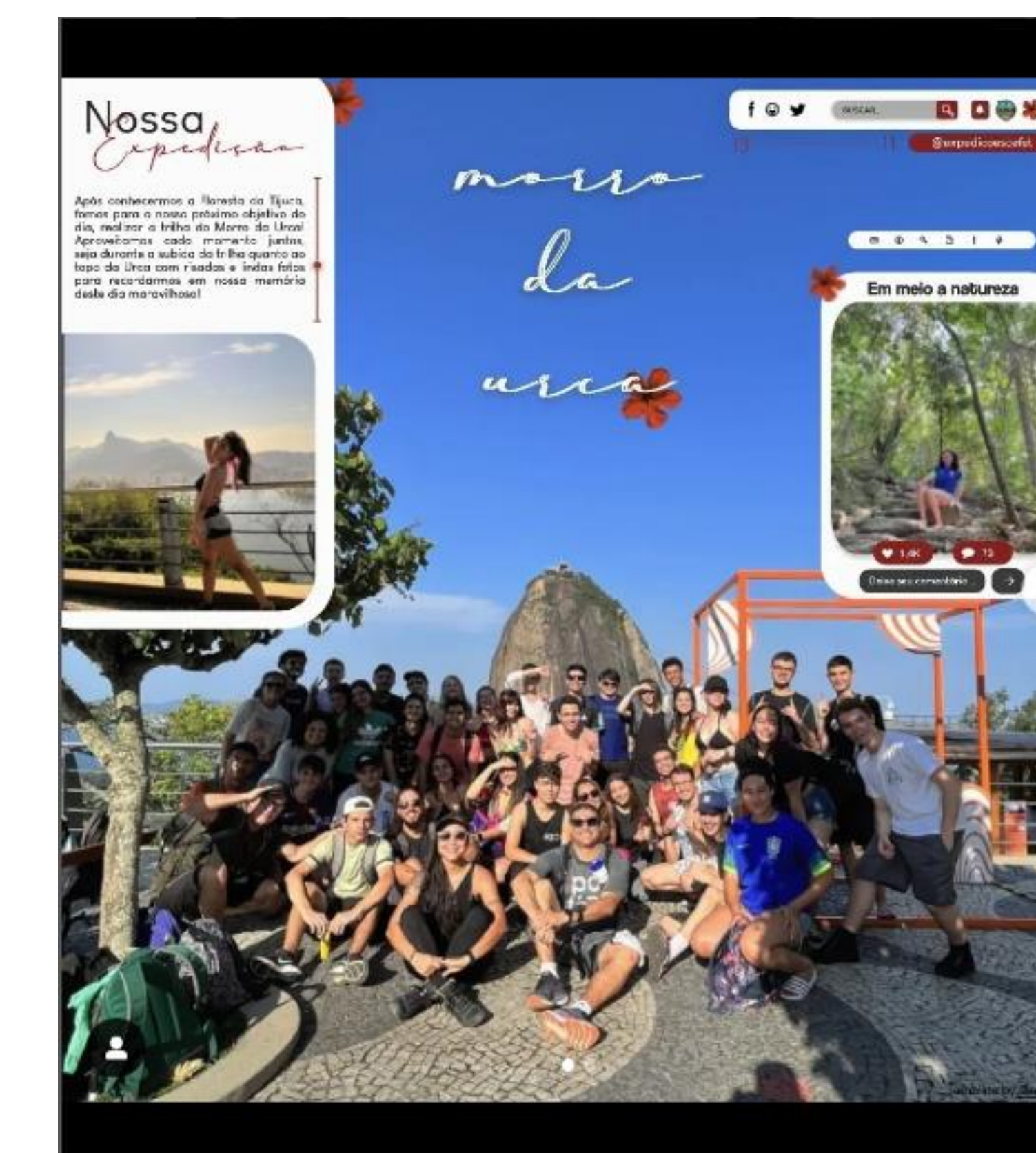
Exemplos de postagens no Instagram do Expedições.