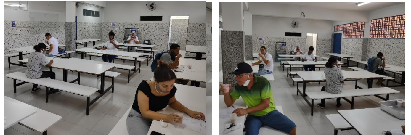
Figuras 4 e 5 - Análise Sensorial: Avaliação das Amostras

Foi solicitada a todos antes da realização do teste sensorial a sua concordância em participar do estudo através da leitura e assinatura do Termo de Consentimento Livre e Esclarecido, conforme as normas éticas destinadas às pesquisas envolvendo seres humanos do Conselho Nacional de Saúde do Ministério da Saúde (Resolução nº 466/2012).