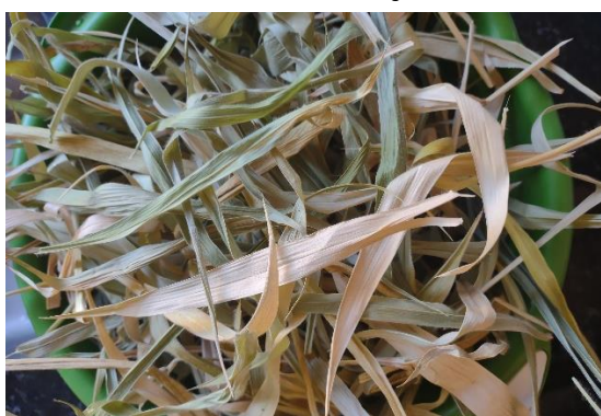
Figura 1 - Resultado da Desidratação da Matéria Prima

A trituração para obtenção da farinha foi feita utilizando um liquidificador industrial, apesar do liquidificador doméstico produzir uma farinha mais uniforme e um pó mais fino, melhorando a textura do material adicionado aos alimentos.